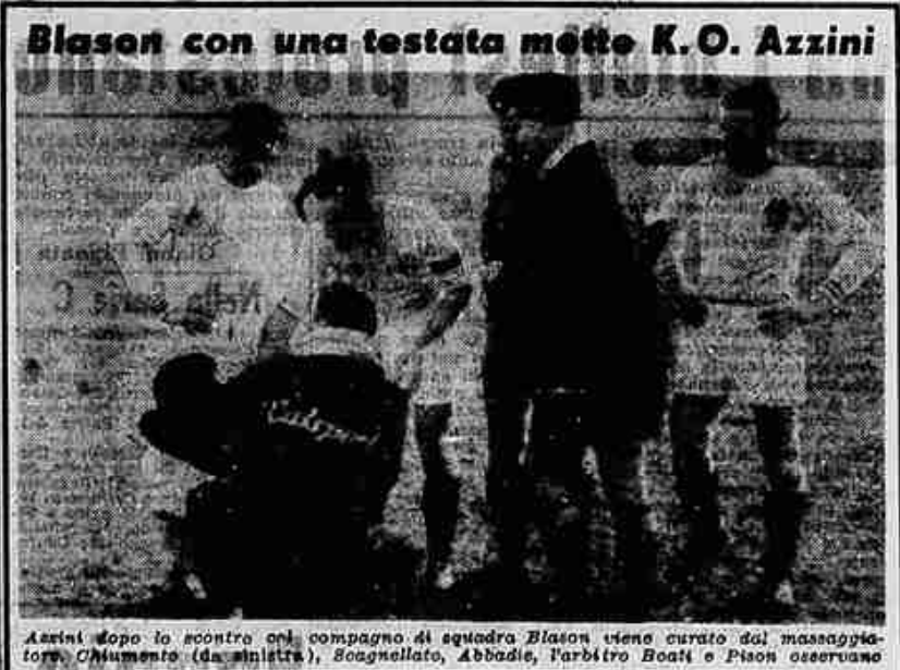
Blason con una testata mette K.O. Azzini

Torneo dei dilettanti GIRONO A: "Trasporti-Villanova 4-1; "Omnia-Comitato 5-1; "Orion-Comitato 1-0; "Borghese-Borghese 0-0. GIRONO B: "Lazio-Albino 0-0; "Ciri-Aquila 2-0; "Virtus Barletta 2-1; "Virtus Vicenza-Caluso 1-0; "Sis-Orion 0-0.