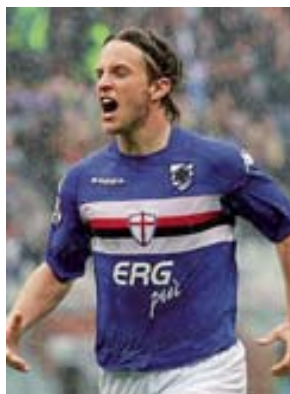
Reto Ziegler, 24 anni