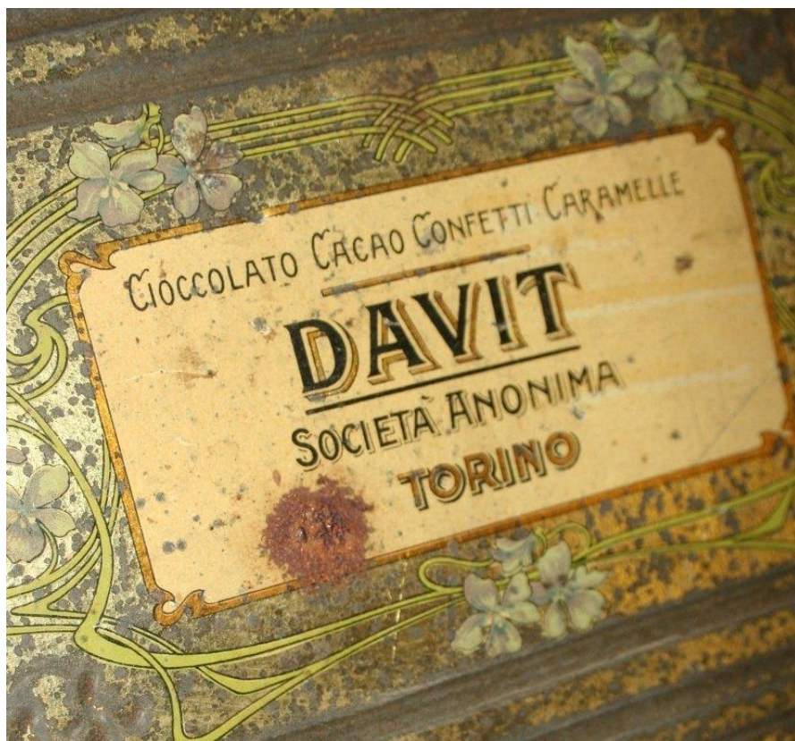
Sopra una scatola di latta della DAVIT che conteneva le delizie prodotte.