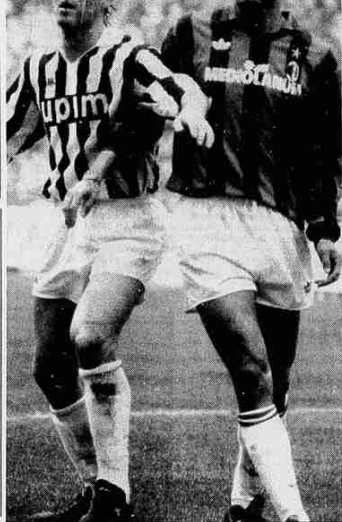
Il Casiraghi in azione