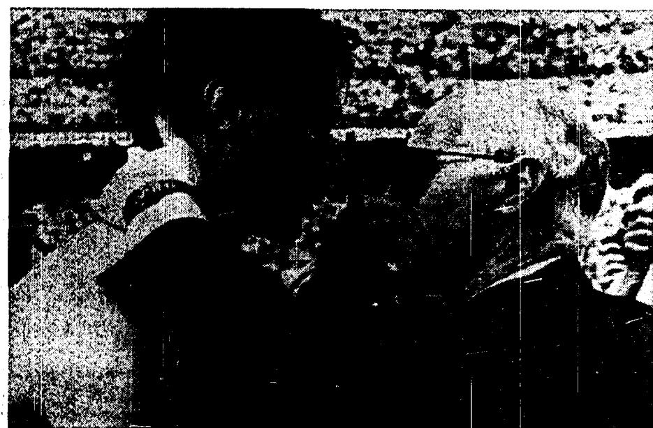
Abbraccio finale tra i due litiganti rossoneri della stagione: Marco Van Basten e Arrigo Sacchi. In basso, l'addio commosso di San Siro all'allenatore di Fusignano che ha vinto tutto sulla panchina del Milan