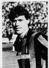
Van Basten è tornato al gol

Arbitro: D'ELIA 6,5 Rate: 91' Van Basten. Ammoniti: 27' Eposito, 33' Barcella, 37' Carbone, 69' Del Bianco, 87' Fontana. Spettatori: pagani 19.910, incasso di 602.284.000 lire, abbonati 4770 per una quota-perita di 114.387.000 lire.