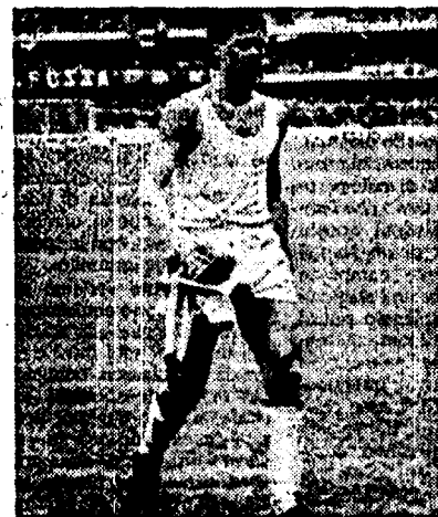
Maradona bacia il pallone che può valere un campionato; a sinistra Van Basten abbandona desolato il campo dopo l'espulsione; a destra Sacchi cacciato da Lo Bello assiste al naufragio della sua squadra dall'imbocco degli spogliatoi tra i poliziotti

I rossoneri prima perdono la testa poi la partita e infine lo scudetto