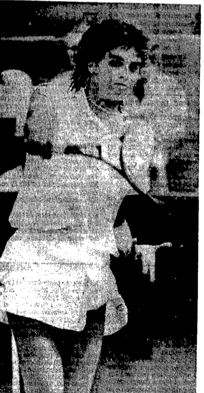
L'argentina Gabriela Sabatini, vincitrice al Foro Italico

bisogno del traduttore simultaneo perché solo la Madonna capisce quello che sta dicendo. Seguite le sue telecronache del tennis dal Foro Italico? Il gioco di Bertoldino è tutto fondato sul serve and volley basato sul fatto che il primo servizio, se non è un ace, è molto slice giocato in back , il che mette in difficoltà Cacaseno costretto a cercare il long line con un drop shot giocato con molto top spin quando non addirittura in lob come si può vedere benissimo se la regia ci rimanda il colpo in slow motion che purtroppo non sarà gustato - visto che non hanno il monitor - dagli spettatori che gremiscono il court e tra i quali ci sono tutte le very important person dello smart set . Vi prego: non fatemelo perdere.