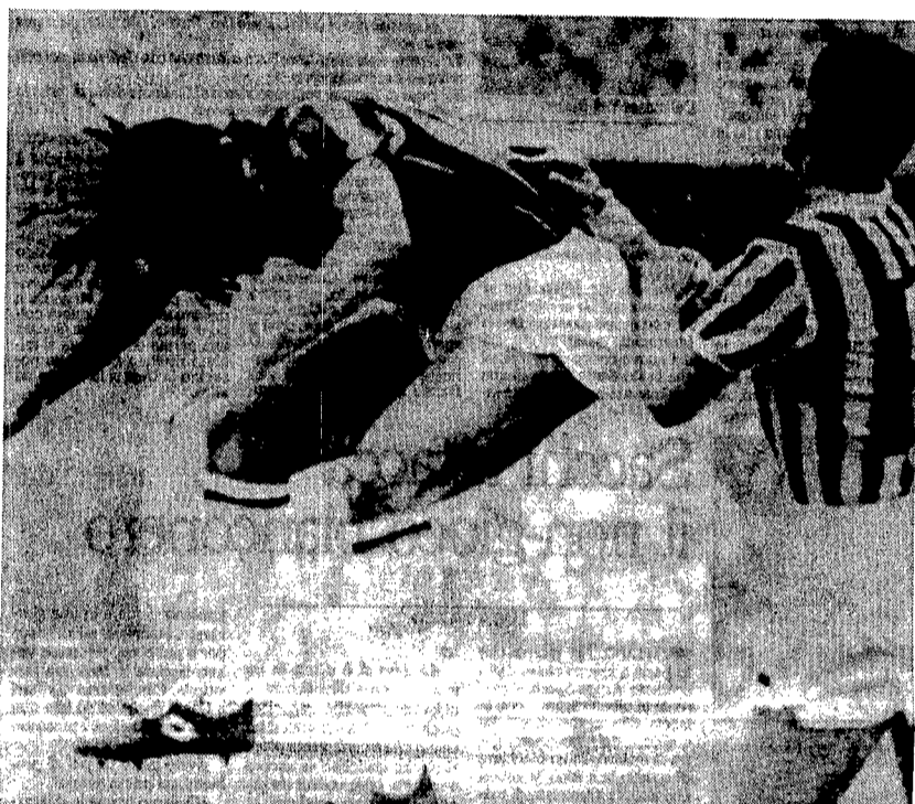
Gullit contrastato da Brio nella partita di San Siro