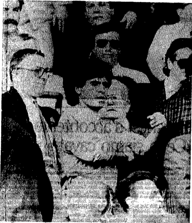
Maradona assiste dalla tribuna alla partita persa dalla sua squadra a Firenze