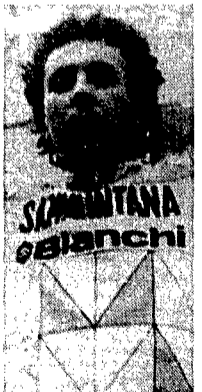
Moreno Argentin sabato alla Sanremo

MERCOLEDÌ 16 CALCIO Coppa europea: ritorno quarti di finale (Sporting Liebona-Atalanta; Werder Brema-Verona) Under 18: qualificazioni europee Italia-Svizzera Under 21: qualificazioni europee, a Nancy Francia-Italia