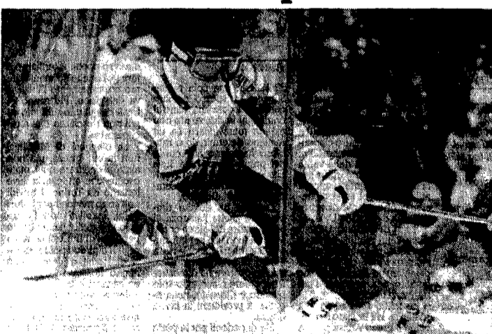
Alberto Tomba non ce l'ha fatta a roscicare punti a Pirmin Zurbriggen. Nel supergigante di ieri in Colorado «Albertone» si è piazzato quinto alle spalle dello svizzero che ha così aumentato di un punto il suo vantaggio in Coppa del mondo