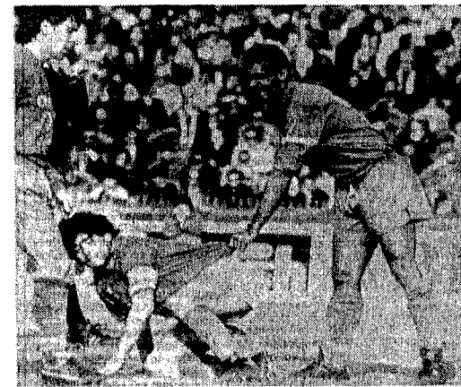
Junior non va troppo per il sottile con Maradona. «Dai alzati e gioca...». Non c'è più rispetto neppure per i campioni

Italia che è l'ultima spiaggia per la Juve ma che è traguardo appetito anche da altre squadre rimaste in lizza. Il cartellone prevede Juve-Avellino, Ascoli-Samp, Empoli-Inter, Napoli-Torino. Di squadre che hanno bisogno di vittorie finali salvatagione non ne mancano certamente e per capire basterà osservare le formazioni. Solo Empoli ed Avellino hanno un conto aperto in campionato, dove la classifica dà ad ambedue spazio per tentare di evitare quelle due scomodissime ultime poltrone.