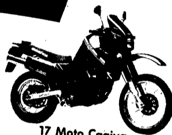
17 Moto Cagiva.