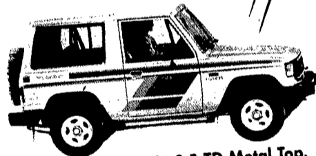
1 Pajero Mitsubishi 2.5 TD Metal Top.