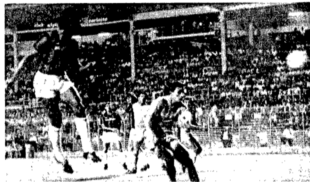
Il gol di Gullit a Como