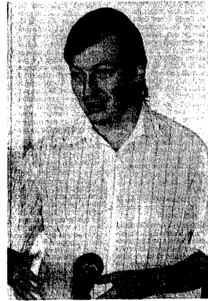
Anatoli Karpov nella conferenza stampa

L'ex campione del mondo di scacchi Anatoli Karpov, in visita a Roma su invito del Banco di Roma pluricampione d'Italia di scacchi a squadre, ha tenuto ieri una conferenza stampa all'hotel Parco dei Principi prima di partecipare alla prima delle due simultanee che lo vedranno impegnato al centro sportivo del sodalizio romano. Di ritorno da Bilbao dove ha presieduto all'assemblea dei Grandi Maestri e preparato il terreno per il quarto match contro l'attuale campione Garry Kasparov (si terrà in ottobre a Siviglia), Karpov è apparso in splendida forma. Alla domanda sulle sue possibilità di successo nel prossimo match contro Kasparov, ha detto: «Dipende dalla preparazione di entrambi. Ovviamente può avere un