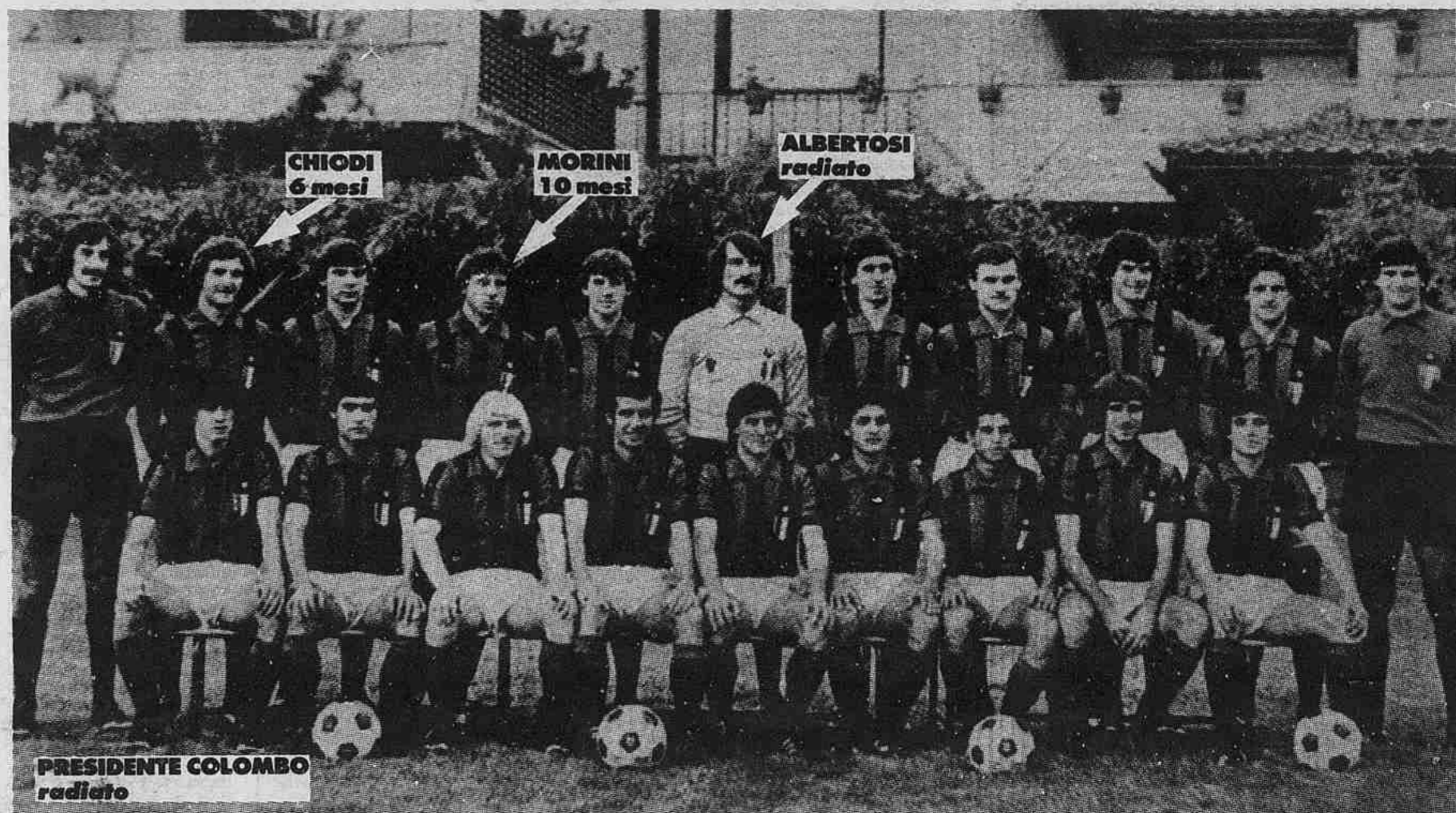
CHIODI 6 mesi