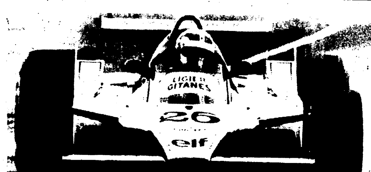
La Ligier del vincitore Jacques Laffite in azione.