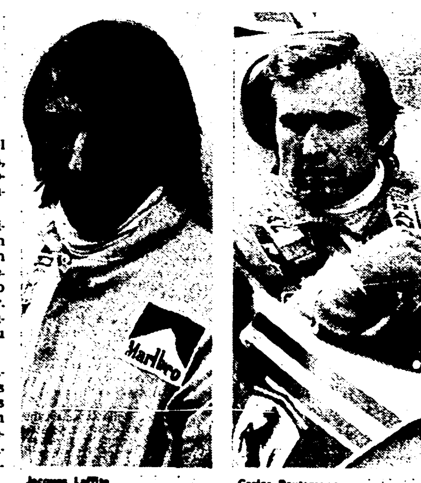
Jacques Laffite e Carlos Reutemann.

Questa la classifica del Gran Premio d'Argentina, prima prova del campionato mondiale di Formula 1: 1. Jacques Laffite su Ligier; 2. Carlos Reutemann su Lotus; 3. John Watson su McLaren; 4. Patrick Depailler su Ligier; 5. Mario Andretti su Ferrari; 6. Emerson Fittipaldi su Copersucar; 7. Elio De Angelis su Shadow.