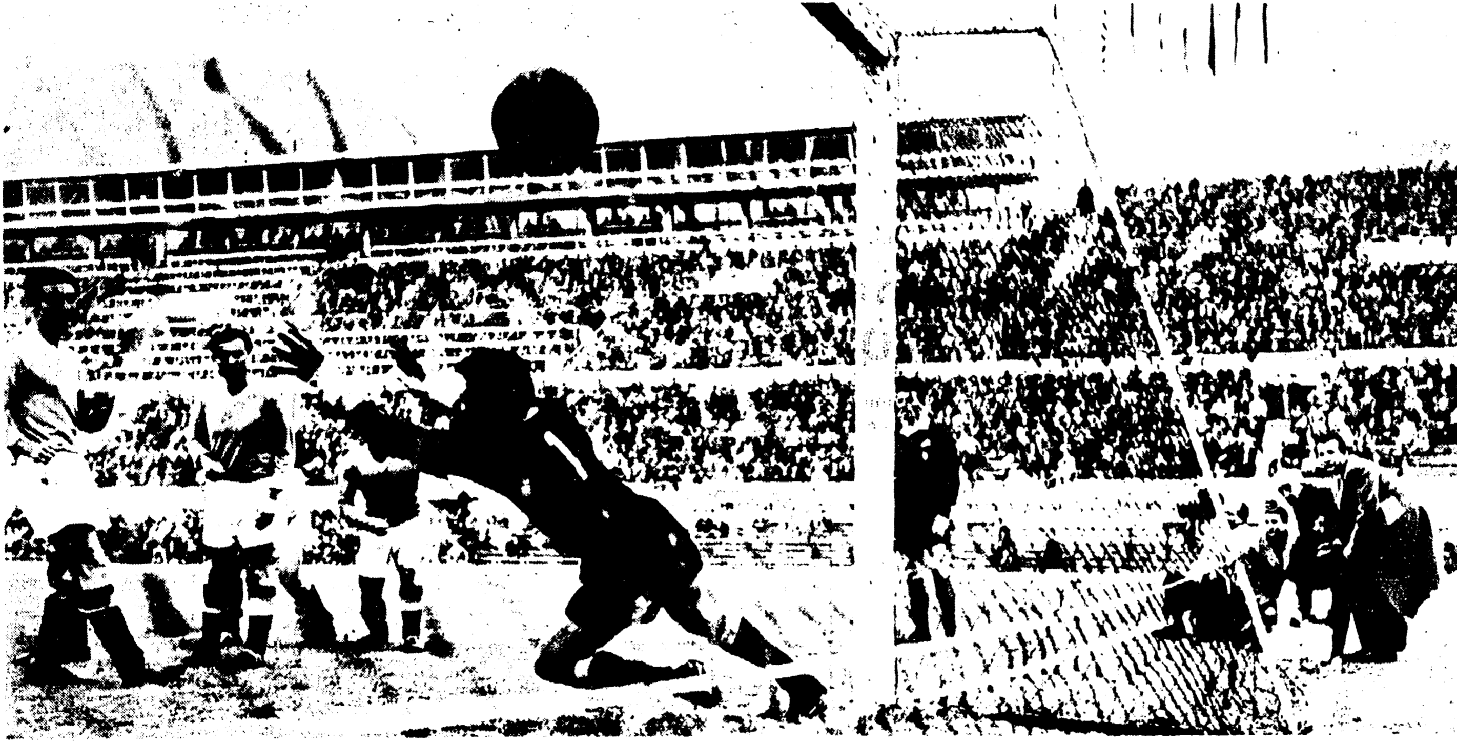
ROMA-NAPOLI 3-0 - BIGATTI e bottata per la terza volta e il goal di David che mette definitivamente K. O. gli sfortunati partenopei