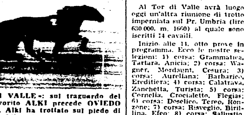
FOTOFINISH AL TOR DI VALLE: sul traguardo del Premio di Capodanno il favorito ALKI precede OVIEDO e lo sfortunato BALABANG. Alki ha trotolato sul piedo di 1'22"7 al chilometro