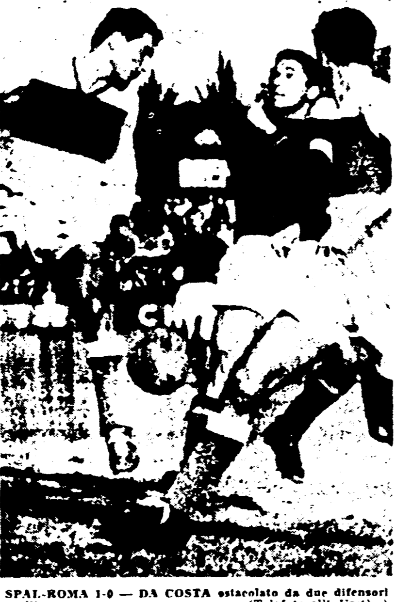
SPAL-ROMA 1-0 - DA COSTA estorcolato dai difensori spallini

Arbitraggio "casalingo", di Marchese - Rozzoni è l'autore dell'unica rete della giornata