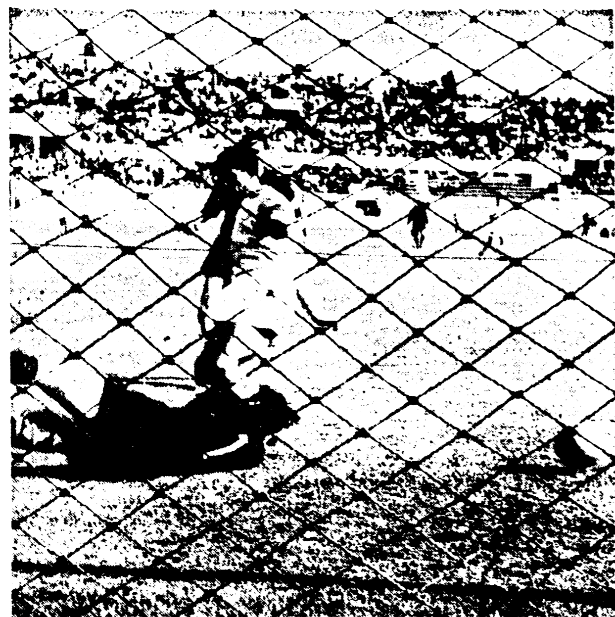
LAZIO-MILAN 0-0 - TOZZI perde una buona occasione