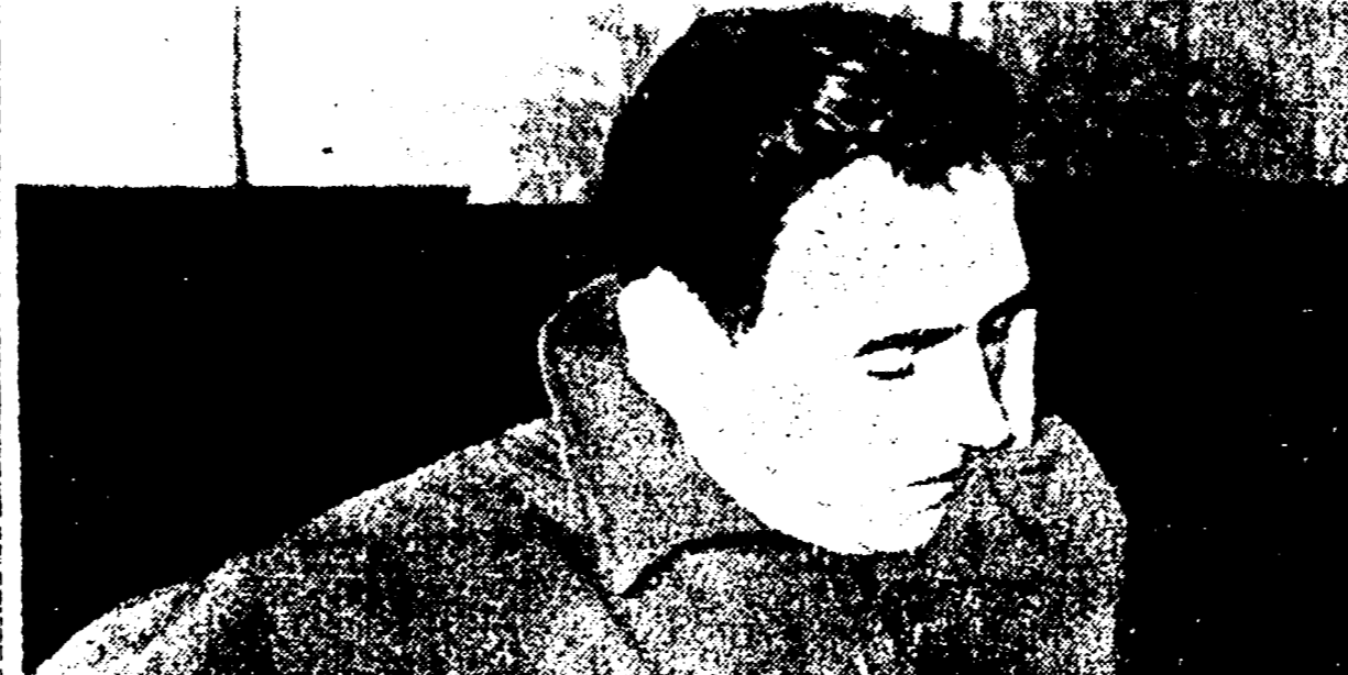
Con 90 probabilità su 100 FONI può considerarsi già giallorosso