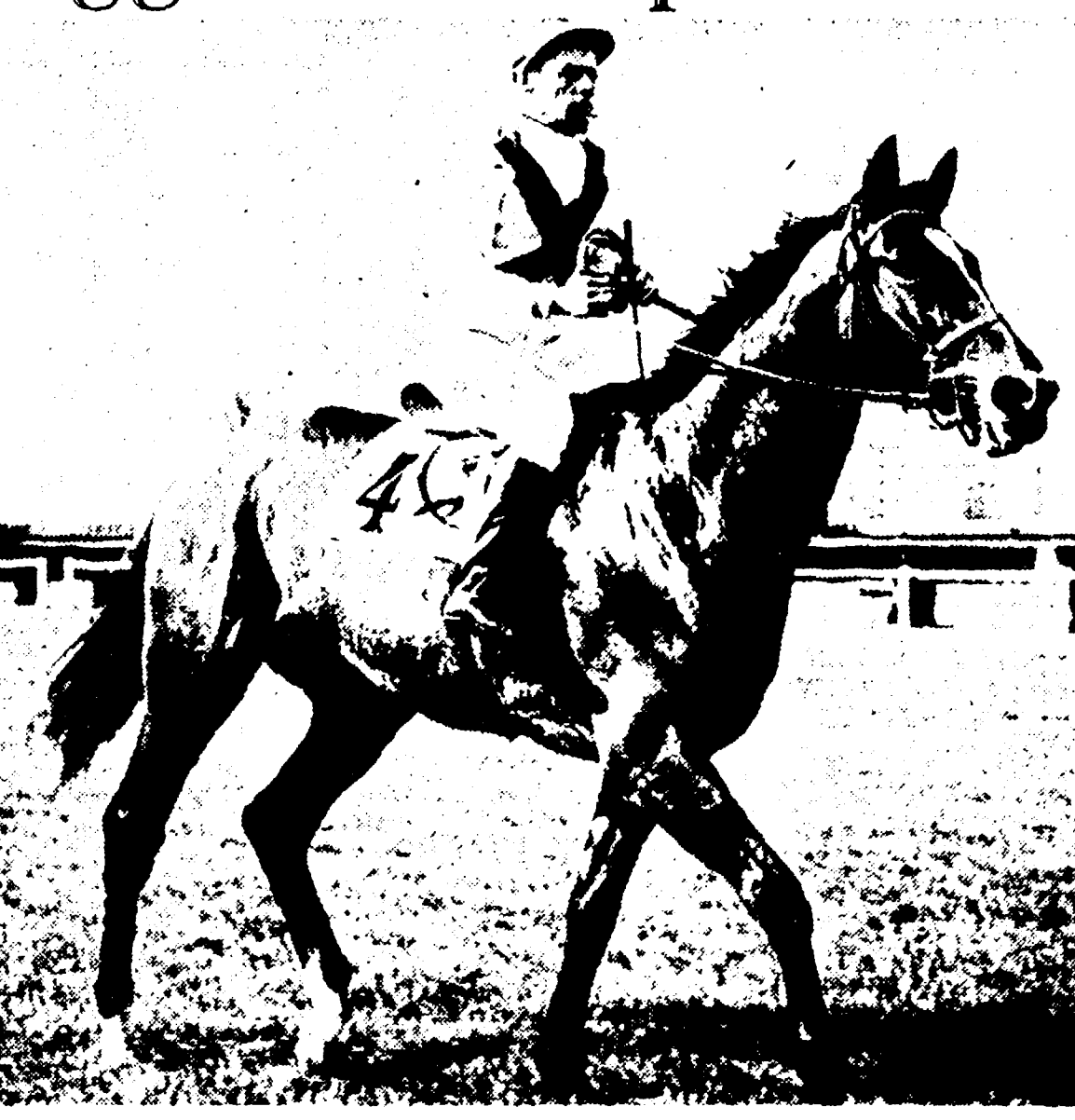
Fiuse nessun derby come questa LXXX edizione si è disputata nel segno di una simile splendida incertezza: i due concorrenti saranno ai nostri e praticamente tutti hanno chances di vittoria anche se il numero dei probabili vincitori rientra in pratica più ristretto per la presenza di Malhoa e Dadae che sulla carta dovrebbero avere compiti di accompagnamento per i 12-13 mila cavalli di cui dovrebbe essere riservato il ruolo di estremo sorpresa.

Il Derby ha sempre avuto, con rarissime eccezioni, cavalli di classe e spesso autentici crack poi impostasi in tutte le grandi occasioni.