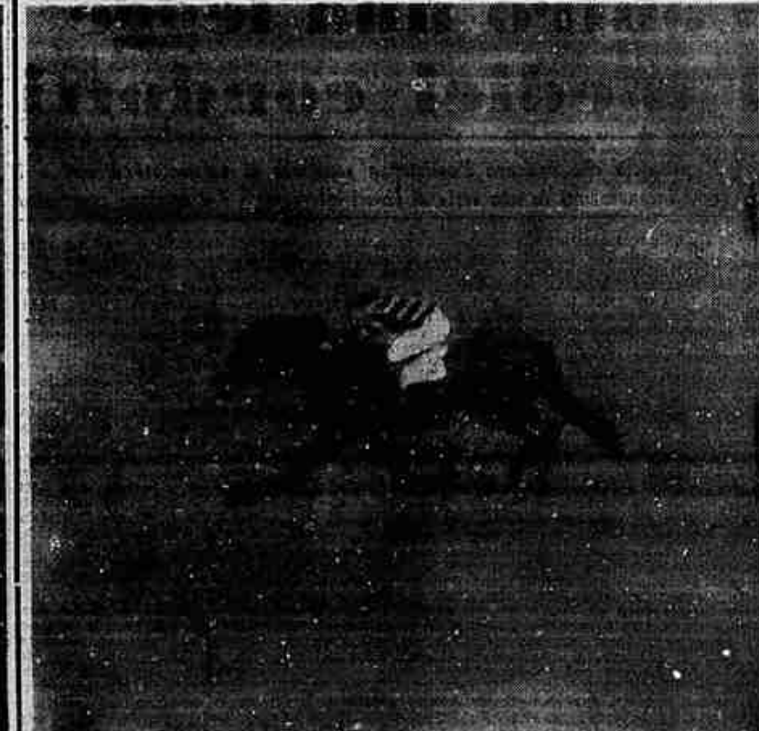
Falerno taglia il traguardo del Premio Roma (15 milioni in palio) battendo per otto lunghezze il francese Ely, che era favorito. Alte quote al totalizzatore. (Tel.)