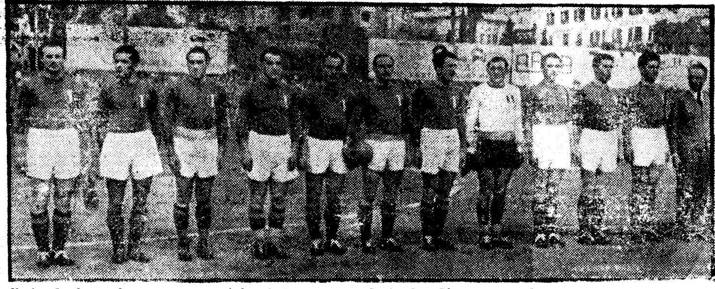
Equipo de la squadra azzurra que actuó recientemente contra Portugal en Génova y que, salvo ligeras variaciones, será el mismo once que se enfrentará a nuestros nacionales, en Chamartín, el próximo domingo con motivo del España - Italia de fútbol